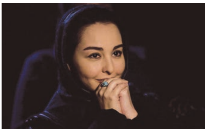
TEN et SHIRIN d'Abbas Kiarostami, tournés en numérique.

besoin de cette dose de réalité, de ce lien photographique avec le monde réel.