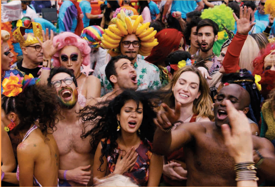
↑ Sense8 des sœurs Wachowski et Joseph Michael Straczynski (2015-2018)