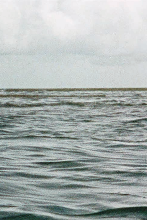
↑ Shock Waves de Ken Wiederhorn (1977)

À travers le régime fantastique, l'horreur accorde l'histoire au diapason de nos craintes les plus profondes. Aux autres genres, on pourrait dire que le cinéma d'horreur oppose ainsi une contre-histoire.