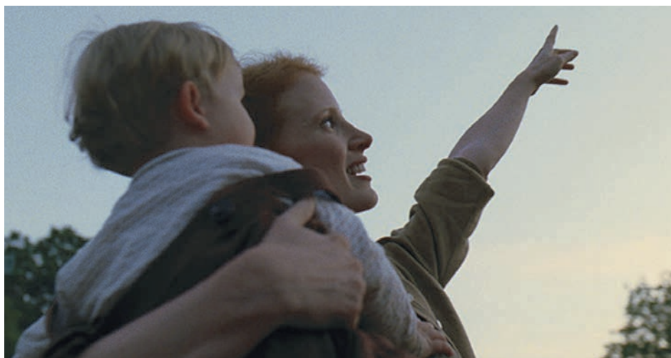
↑ The Tree of Life de Terrence Malick (2011) → Arrival de Denis Villeneuve (2016) → Gravity de Alfonso Cuarón (2013)