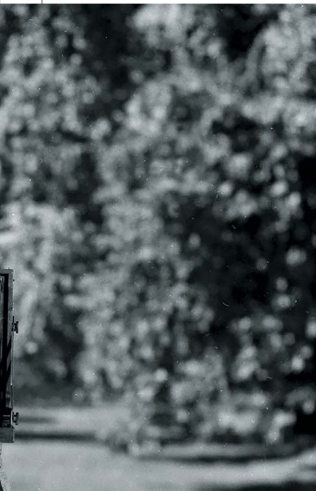
Kind Hearts and Coronets de Robert Hamner (1949) →