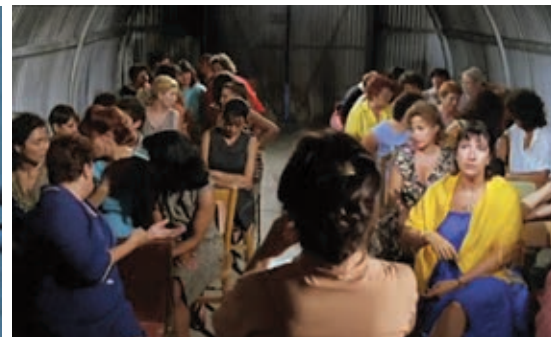
L'ARGENT FAIT LE BONBHEUR de Robert Guédiguian

Une œuvre luttopique n'est pas la mise en scène ou en images d'une idée. Elle permet de « penser en homme d'action et d'agir en homme de pensée » (Bergson) afin de ne pas se contenter du kantisme de la pureté de l'idéal jamais sali par l'action concrète. C'est une action poétique (du grec poiëin , faire), un langage en train de se faire dans l'immanence, c'est-à-dire dont l'activité n'est pas séparable de ce sur quoi elle agit.