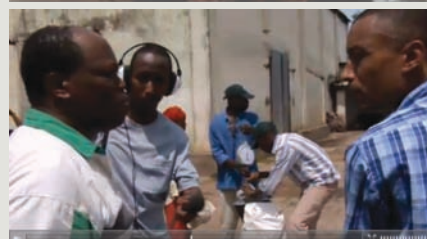
Jour 1 : Sommeil de satin Jour 12 : Give me one hundred Jour 30 : Distribution alimentaire, Afrique