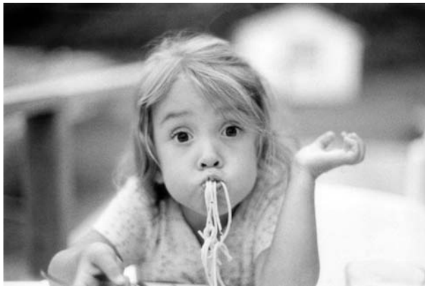
Précis du quotidien