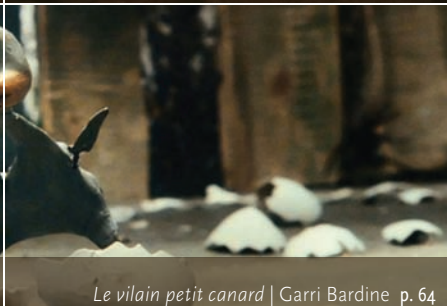
Le vilain petit canard | Garri Bardine p. 64