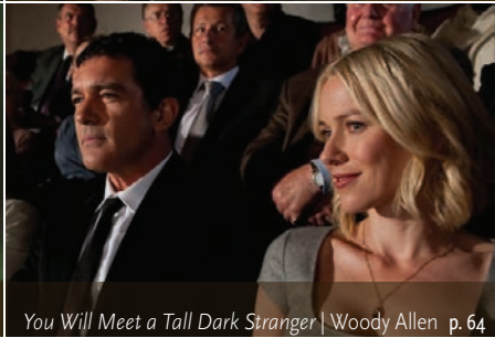
You Will Meet a Tall Dark Stranger | Woody Allen p. 64