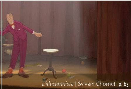
L'illusionniste | Sylvain Chomet p. 63