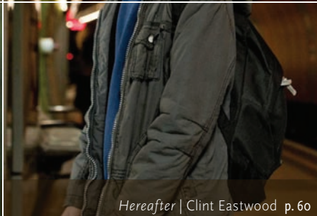
Hereafter | Clint Eastwood p. 60