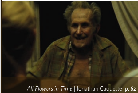
All Flowers in Time | Jonathan Caouette p. 62