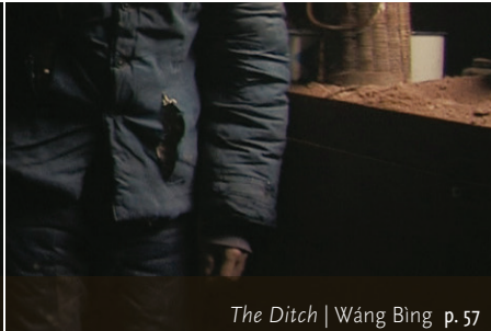
The Ditch | Wáng Bing p. 57