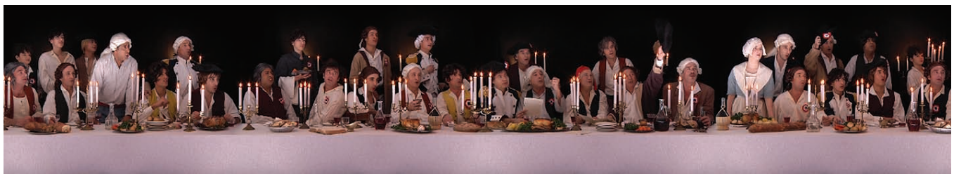
Mémorial de la Marseillaise d'Anne Van den Steen et Dominik Barbier

IL Y AVAIT LONGTEMPS, MIS À PART DANS LES TRAITÉS D'ASTRONOMIE, QUE LE MOT «révolution» n'avait surgi sur le devant de la scène de l'Histoire avec toute sa fraîcheur émotive et émancipatrice. Ce sont les peuples arabes qui ont su en ce début de 2011 le réactualiser et lui redonner une force subjective attrayante. La révolution est une voie pour passer d'un état à un autre en imposant une rupture qualitative. On retrouve aussi cela dans la nature quand par exemple l'eau, en atteignant les 100° C, se transforme en vapeur. Mais que reste-t-il de son état antérieur? La table rase du passé est un leurre. La mémoire travaille le présent, et inversement. C'est dans ce mouvement de balancier que se situe l'acte de création.