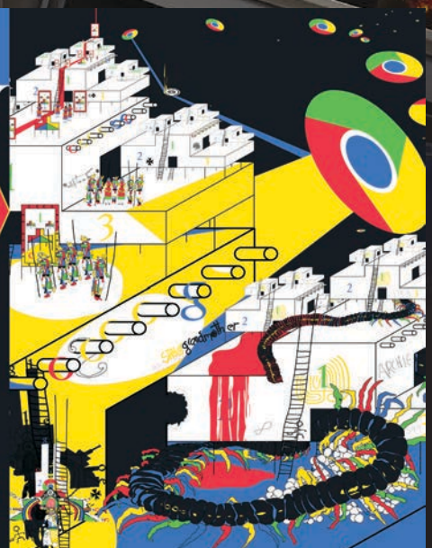
> ( FFirst ) Family First Magazine de février 2014, p. 26-27 © Hugo Nadeau.