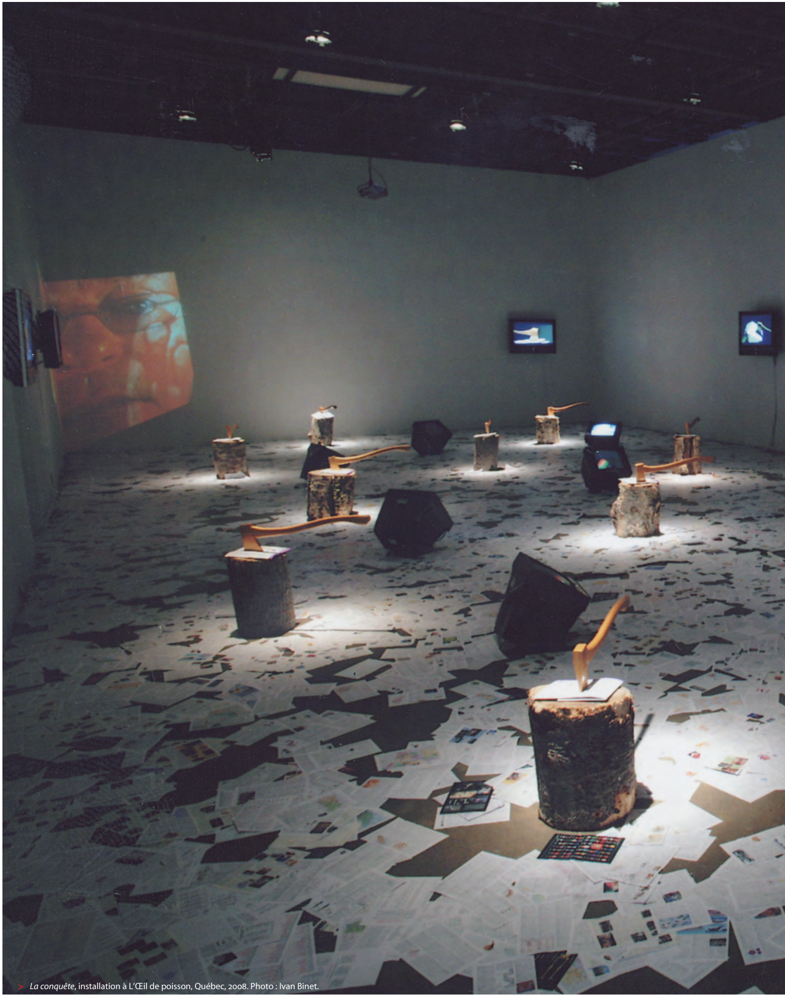
> La conquête , installation à L'Œil de poisson, Québec, 2008.