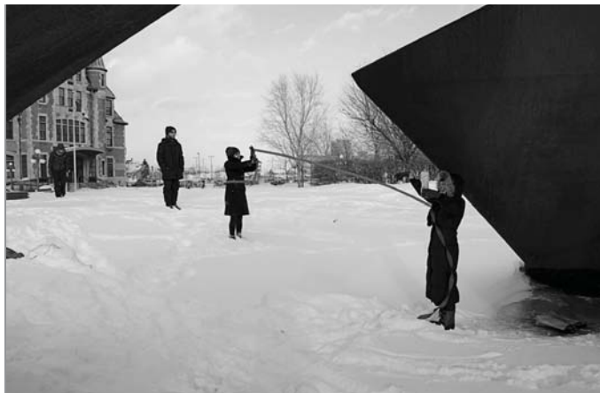
> Gare VIA rail, Québec, février 2014.

« Est membre du Tas quiconque participe au Tas. » « Ce n'est que dans l'action que Le Tas existe. » Ces mots, prononcés autour d'une table, dans un café, quelques minutes après une action, décrivent selon moi ce qui est l'essence du Tas : sans permanence, sans forme, malléable, inclusif, subversif, invisible. Pour le reste, puisque ce n'est que dans l'action qu'il existe, ce n'est que dans l'action que l'on peut espérer comprendre réellement ce qu'il est.