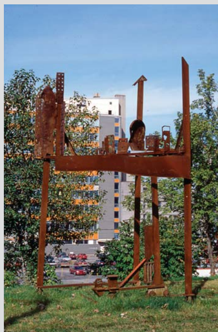
> Thelonious Monk . Acier, 365 x 213.4 x 183 cm, 1993.