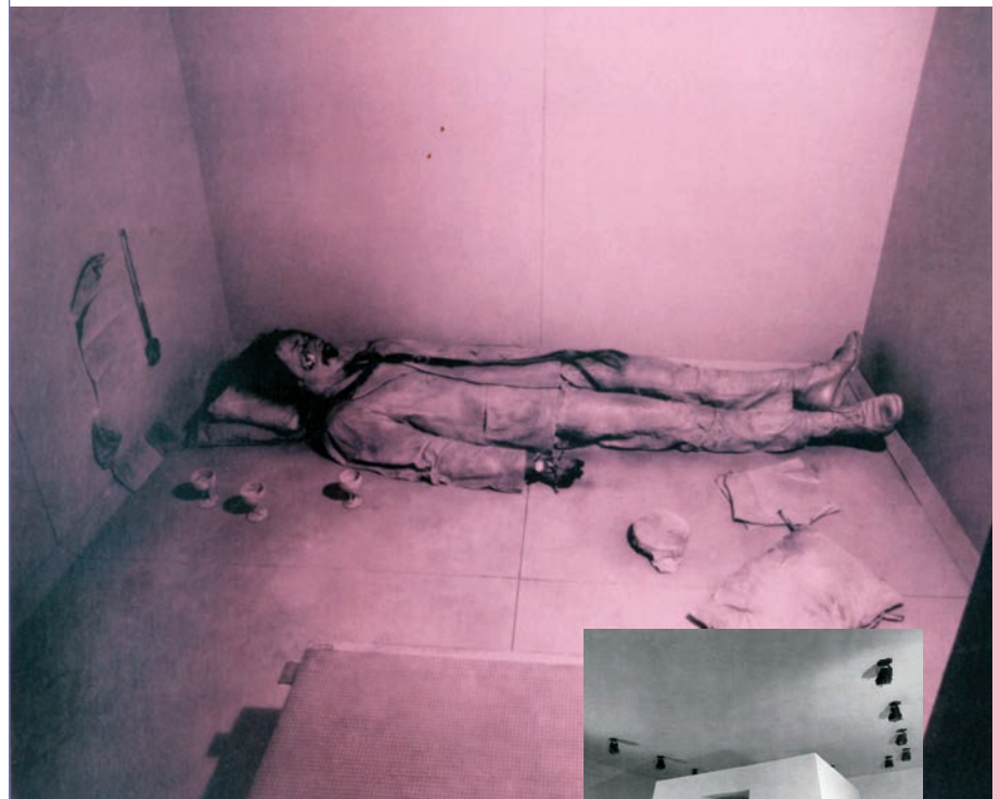
> Paul Thek, The Tomb , vue de l'installation avec éclairage rose, Stable Gallery, New York, 1967.

Paul Thek, artiste de la côte ouest-américaine, est reconnu comme précurseur de l'installation. Il s'est d'abord fait connaître en exposant dans des boîtes en plexiglas des sculptures de cire figurant des morceaux de viande ou des parties du corps humain. The Tomb , une installation réalisée en 1967, présente une effigie pleine grandeur de lui-même (son cadavre simulé, langue visible, main coupée) étendue entouré de divers objets dans un caveau, une sorte de petite pyramide à degrés rappelant une ziggourat. L'installation a été présentée en 1967, à la Stable Gallery de New York, sous un éclairage rose et, en 1968, à l'Institute of Contemporary Art de Londres sous le titre Death of a Hippie . ◀ RICHARD MARTEL