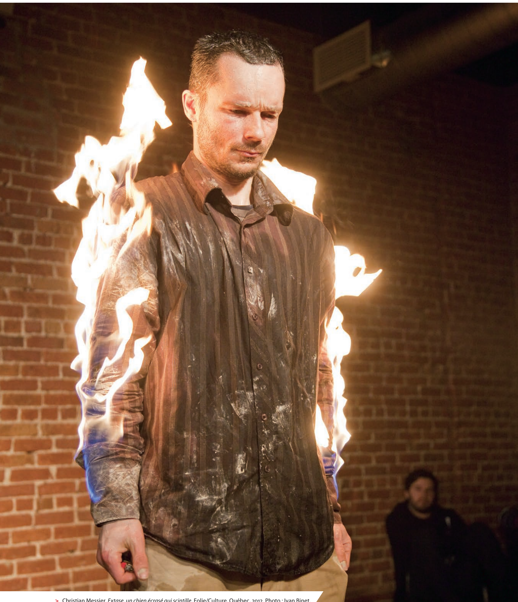
> Christian Messier, Extase, un chien écrasé qui scintille , Folie/Culture, Québec, 2012.