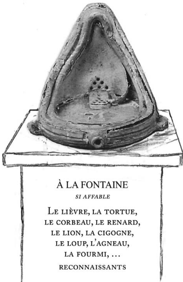
> Stèle à La Fontaine.