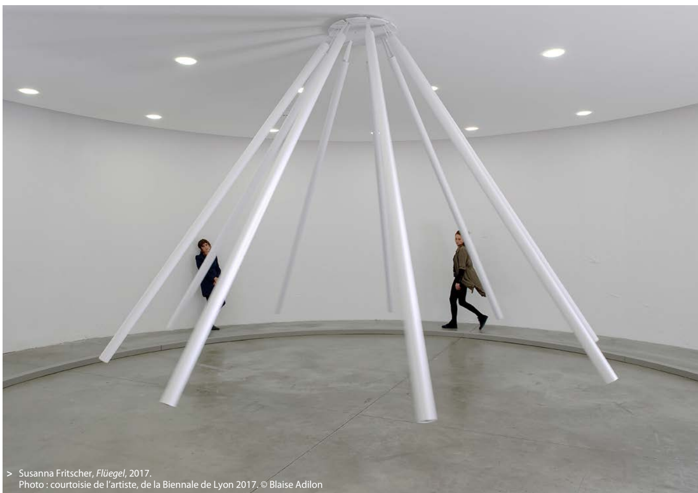
> Susanna Fritscher, Flügel , 2017.