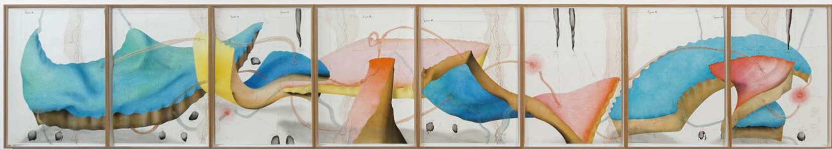
> Jorinde Voigt, The Shift I-VII , 2017. Photo : courtoisie de l'artiste, de la Biennale de Lyon 2017, Studio Jorinde Voigt, König Galerie. © Blaise Adilon © Adagp

Paul Ardenne est historien de l'art, écrivain et commissaire d'exposition. Il est l'auteur de plusieurs ouvrages de référence sur la création moderne et contemporaine : Art, l'âge contemporain (1997), L'art dans son moment politique (2000), L'image corps (2001), Un art contextuel (2002), Art, le présent (2009), Cent artistes du street art (2011), Heureux, les créateurs ? (2016)... Dernier ouvrage paru : Roger-pris-dans-la-terre (roman, 2017). À paraître : Un art écologique : création plasticienne et anthropocène (essai, éditions Actes Sud, septembre 2018).