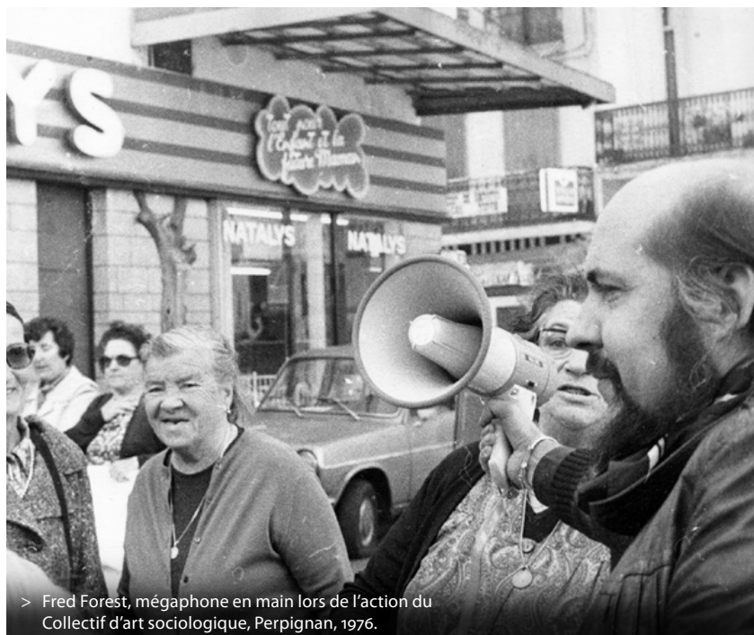
> Fred Forest, mégaphone en main lors de l'action du Collectif d'art sociologique, Perpignan, 1976.

Manifestement, l'exposition des deux protagonistes principaux de l'art sociologique à Beaubourg relance son actualité. Oui ! L'art sociologique est toujours bien vivant ! Il n'est pas uniquement une remémoration froide d'un passé exhumé avec des archives. Pour ma part, après les performances collectives réalisées et la tribune que j'ai utilisée dans un esprit permanent de critique institutionnelle, les démêlés polémiques que j'entretiens actuellement avec l'institution prolonge pour ainsi dire mon exposition hors les murs, et je demande la reconduction de mon exposition, après le sabotage systématique dont elle a été victime après le départ d'Alain Seban de la présidence du Centre Pompidou. Pensant que nous avons tous désormais un intérêt commun à réunir nos efforts pour donner plus de visibilité à l'art sociologique, je propose à Beaubourg, pour faire suite aux expositions personnelles d'Hervé Fischer et de Fred Forest, une expo sur l'art sociologique qui prendrait le relais et en assurerait la continuation logique.