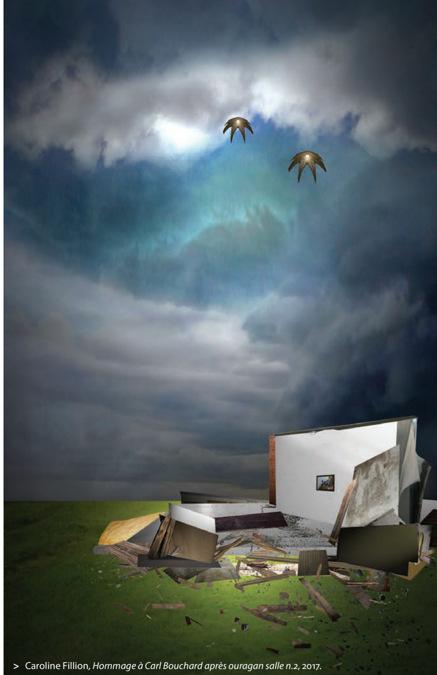
> Caroline Fillion, Hommage à Carl Bouchard après ouragan salle n.2 , 2017.

La notion de blade runner provient d'une première adaptation du roman de Philip K. Dick, mettant en scène une planète surpeuplée où les citoyens se soumettent aux politiques de procréation des pouvoirs en place. Quelques citoyens refusent la stérilisation, se privant ainsi de tout accès à des soins médicaux, sauf clandestinement grâce à des « passeurs de scalpels » de contrebande. Il n'y aurait, en effet, que le fil du rasoir pour départager les humains dits naturels des humanoïdes synthétiques 3 . Dans Blade Runner 2049 , la nouvelle classe d'humanoïdes, menée par une matriarche cyclopéenne,