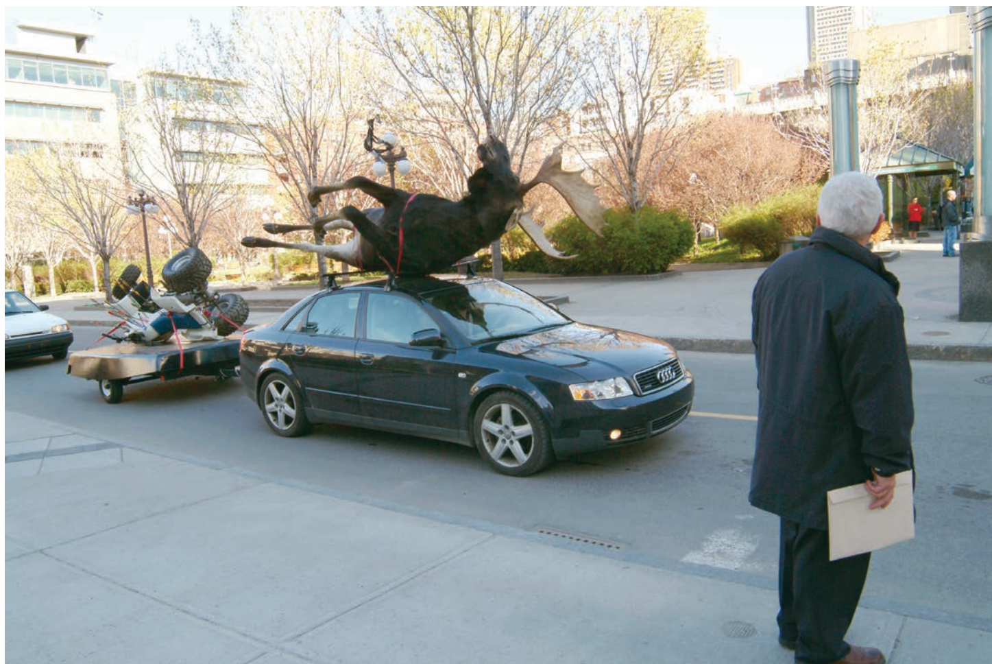
> BGL, Manif d'art 3 , 2005.