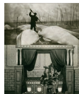
> Maryse Goudreau, extraits du projet Bombardements , 2012.