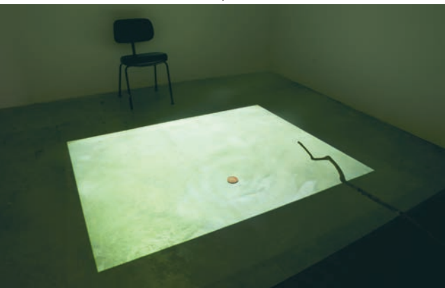
> Cédric Arlen-Pouliot, Reflects.