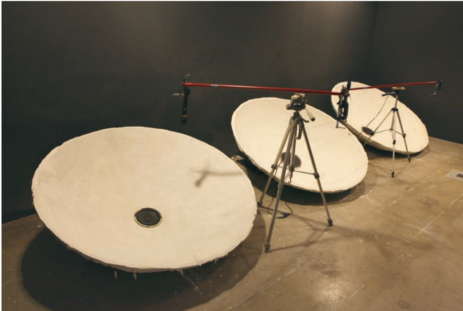
> Mathieu Valade, Prothèses acoustiques .

Les installations et projections ont créé une confluence entre l'espace, les objets, les images et l'action du public. Exigeant une altération du temps d'observation, les travaux demandaient une disponibilité à se laisser plonger dans l'absorption. Reflects , de Crédric Arlen-Pouliot, une installation vidéo composée d'un bâton, d'un cercle de bois attaché à son extrémité par un fil et de la projection au sol d'une image se reflétant dans une surface liquide, invitait le spectateur à l'interactivité. Le glissement du cercle dans l'image, un effet de déplacement dans l'image, donnait l'impression de jouer et de dessiner sur un plan liquide. Le jeu entre l'attente de ce qui sera donné à voir et l'association à l'expérience presque commune transformait en « piège » ce travail pour le visiteur pressé, désirant voir rapidement et superficiellement l'exposition. Qui ne s'est jamais un jour amusé à dessiner sur l'eau et à observer cette action se défaire et se diluer sous les yeux en une ineffable immatérialité ? La rencontre de cette invitation à la participation et la manière dont elle retenait l'attention créaient un espace temporel propre aux moments consacrés au jeu, à la récréation, au loisir et au plaisir de se laisser aller à la contemplation.