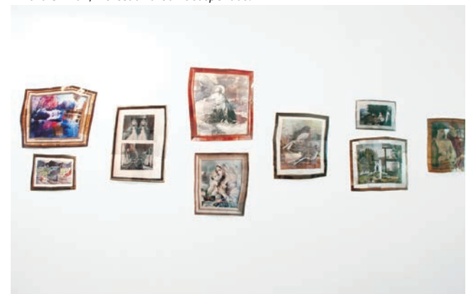
> Florence Le Blanc, La collection .