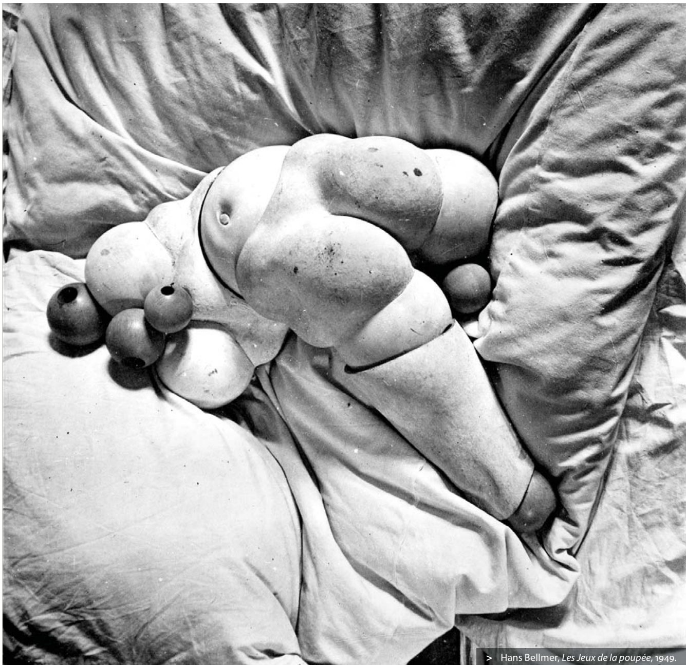
> Hans Bellmer, Les Jeux de la poupée , 1949.

L'ampleur du mouvement qui précède et excède la forme concrétisée du désir donne conscience aux libertins de Sade de l'impuissance et de la perpétuelle insatisfaction que ce rapport non proportionnel entre imagination et réalité implique : « Pour moi, nous dit Durcet, j'avoue que mon imagination a toujours été sur