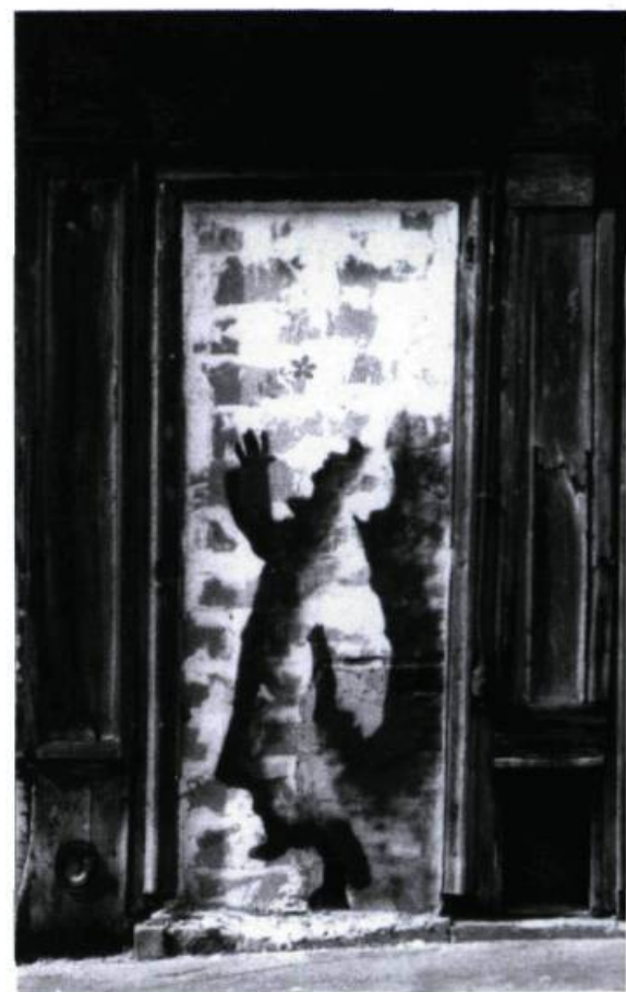
Hans BLUMBERG, Wirklichkeiten in denen wir leben , Philipp Reclam jr. Stuttgart, 1981.

Traduit librement de l'espagnol et adapté par Luc LÉVESQUE