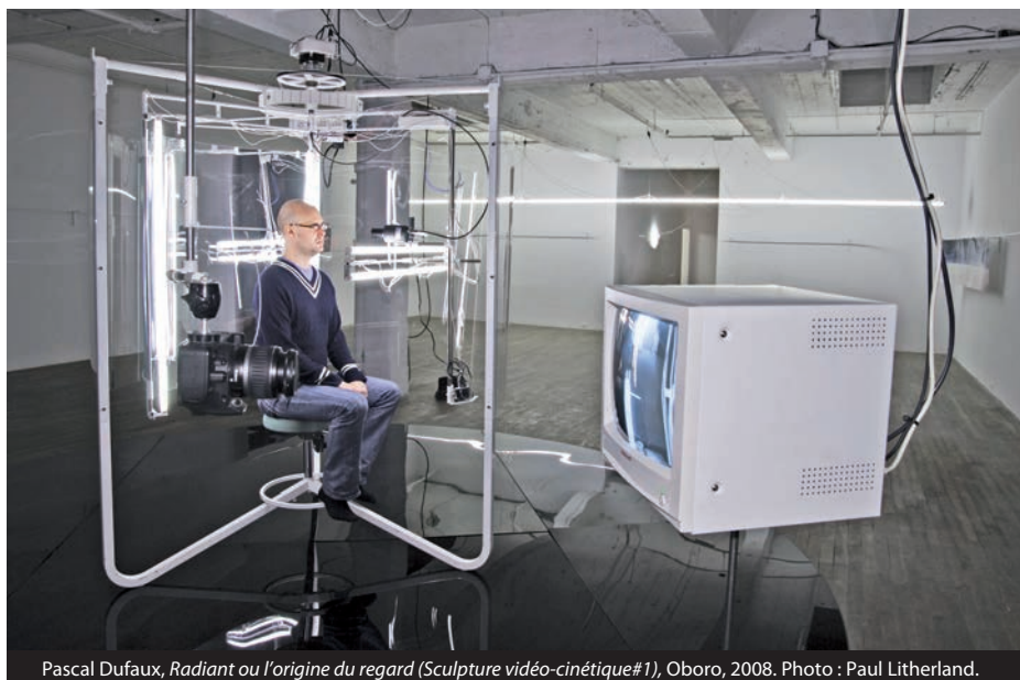
Pascal Dufaux, Radiant ou l'origine du regard (Sculpture vidéo-cinématique#1) , Oboro, 2008.

Faisant l'expérience du Cosmos... , nous sommes dans une sorte d'expectative de voir ce que voit l'œil-caméra. Il est difficile, évoquant ces termes, de ne pas penser à L'homme à la caméra (1929) de Dziga Vertov, bien que nous en soyons loin dans l'intention ou plutôt la non-intentionnalité qui caractérise le comportement des dispositifs de Pascal Dufaux. Ici, le monde s'écoule à l'écart des actions signifiantes qui structurent la vie active, alors que le film de Vertov nous montre un monde multiplié par le flot d'images qui le constitue et le transporte dans sa propre trame temporelle, du lever du jour à la tombée de la nuit. Une journée « moderne », captée et accélérée en cut & paste . L'homme à la caméra est lui-même regard, l'œil s'ouvre et se referme en une suite segmentée, s'avance à travers la matérialité des choses, rencontre leur opacité. Leur mystère est matière, immatière . Les caméras captent tout, rien n'est laissé. Puis on ferme les yeux, on fait nuit, on imagine. En l'absence du regard, il y a le monde qui continue et le cosmos qui demeure – au-dehors comme à l'intérieur – sans surveillance. ◀