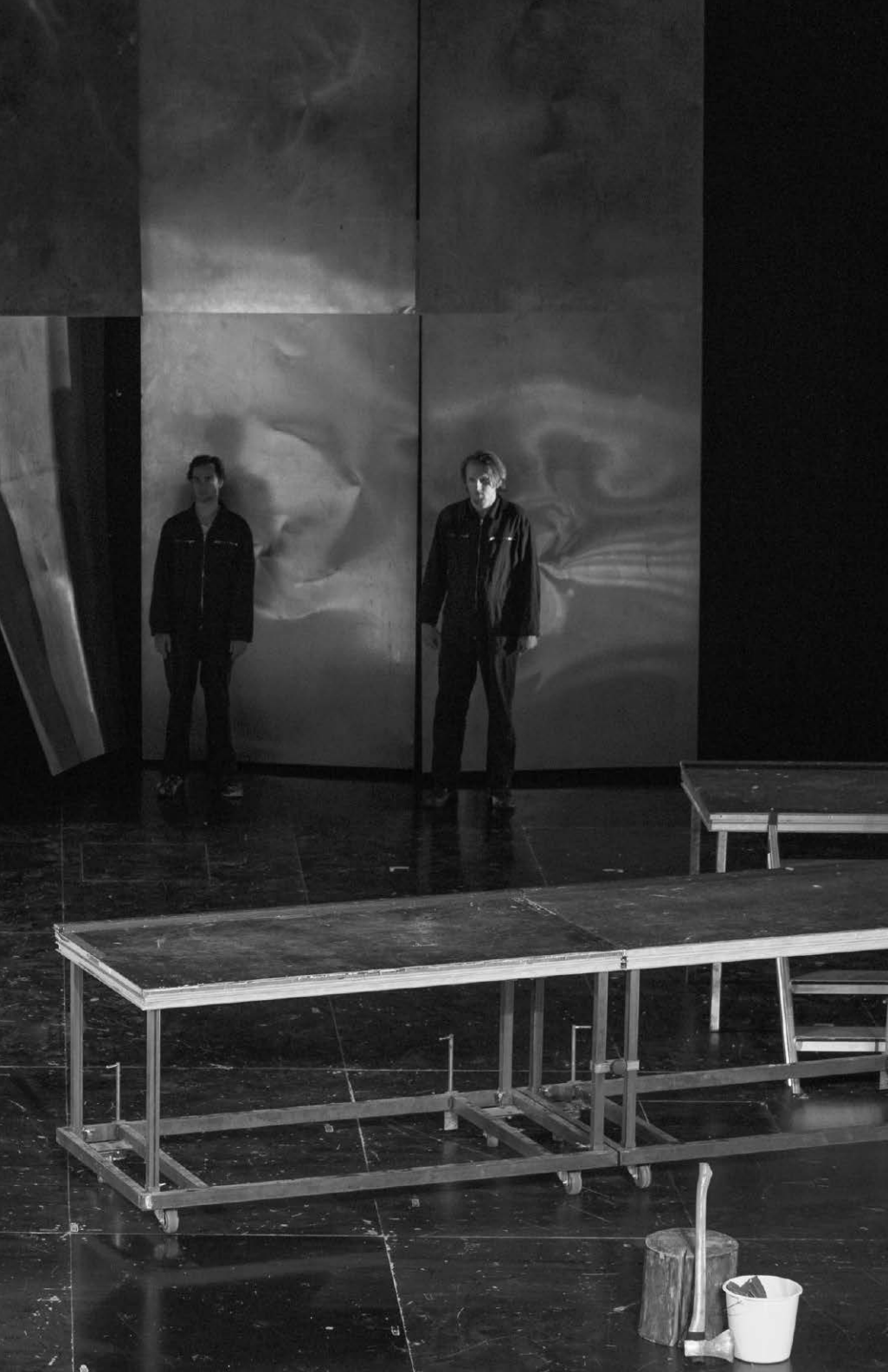
Faust I et II de Goethe, mis en scène par Nicolas Stemann et présenté au Festival d'Avignon 2013.