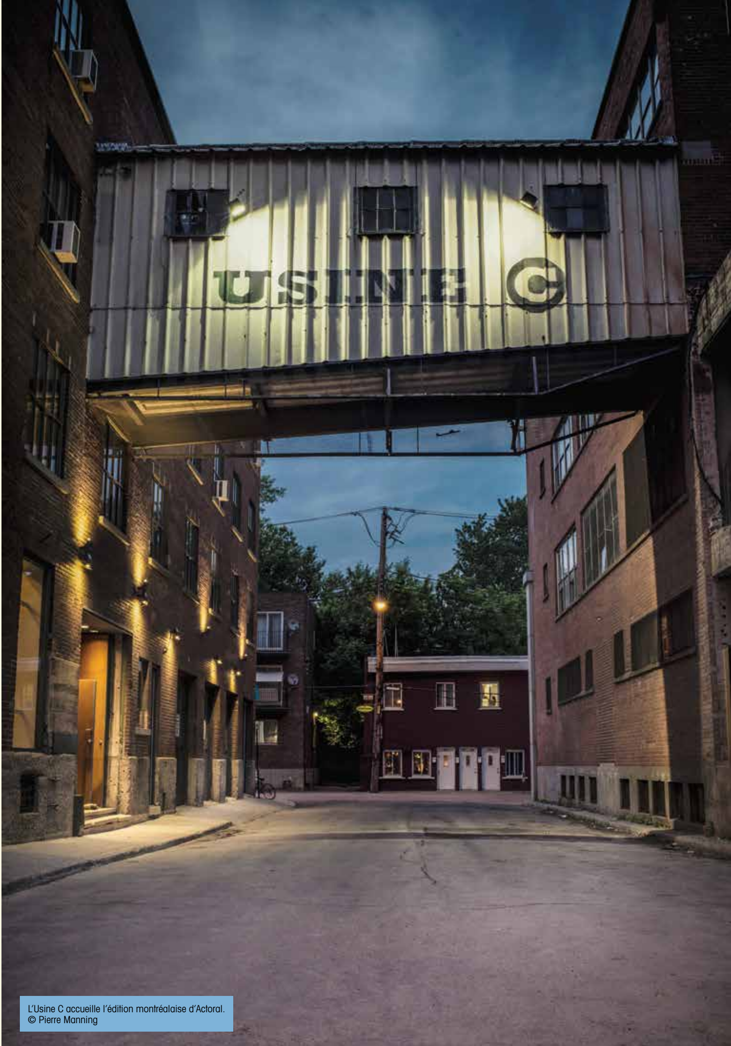
L'Usine C accueille l'édition montréalaise d'Actoral.