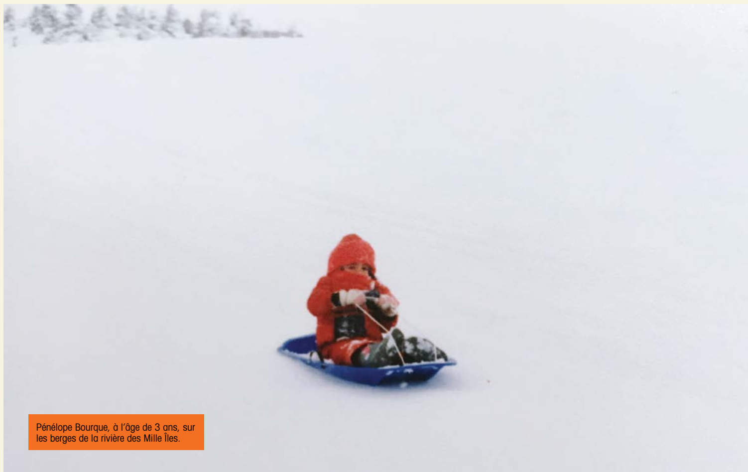
Pénélope Bourque, à l'âge de 3 ans, sur les berges de la rivière des Mille Îles.