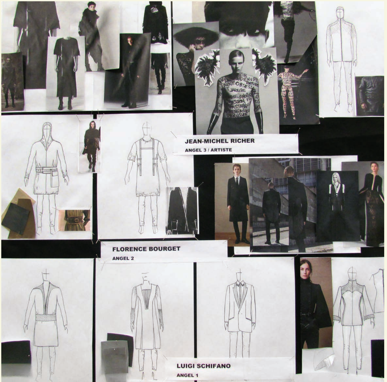
Maquette de Philippe Dubuc pour les costumes des anges dans l'opéra Written on Skin . © Raymond Bertin