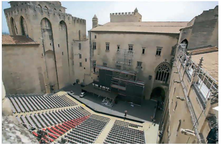
La cour d'honneur du Palais des papes, Festival d'Avignon, en juillet 2019.

Sur le plan historique, le théâtre populaire a connu ses heures de gloire en France, notamment sous la gouverne du metteur en scène Jean Vilar, fondateur du Festival d'Avignon et directeur du Théâtre national populaire.