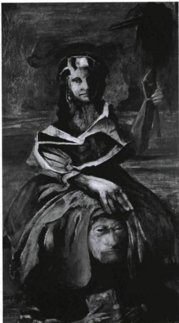
Les 20 jours du théâtre à risque.