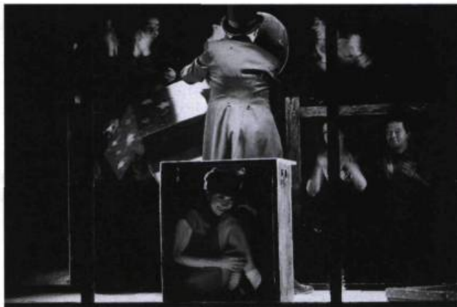
Les Sept Branches de la rivière Ota (version intégrale) d'Ex Machina (Québec).

tchèque qui a échappé, enfant, au camp de concentration, une chanteuse d'opéra juive, une hibakusha ( survivante défigurée par les effets de la bombe nucléaire), un photographe américain venu rassembler des preuves des dégâts... et son fils mi-américain, mi-japonais qu'on verra, aux États-Unis, à la recherche de son père longtemps après le départ de celui-ci du Japon, et de nombreux autres personnages dont les vies s'entrecroiseront à différents moments, Lepage réussissant, tel un deus ex machina , à relier les destins de tous ! Il y a là près de cinquante ans d'Histoire mais aussi de vies privées, d'Amsterdam à New York en passant par Paris, d'Hiroshima à Hiroshima. Le mégaspectacle multiplie les images d'un esthétisme parfait et souvent bouleversantes.