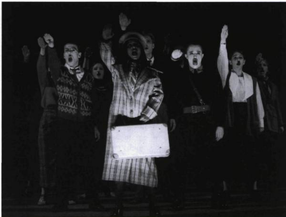
Méphisto , mis en scène par Serge Denoncourt, présenté par le Théâtre du Trident (Québec).

gestes politiques de ses admirateurs et souteneurs nazis. Le thème des rapports entre l'art et le pouvoir intéresse toujours, mais ce qui a surtout retenu mon attention dans ce spectacle, c'est le portrait de la société allemande avant que n'éclate la Deuxième Guerre mondiale, portrait qui fait beaucoup réfléchir.