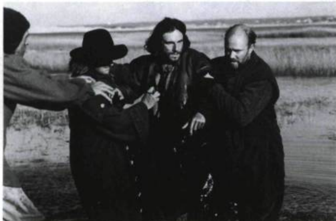
John Proctor (Daniel-Day Lewis) est arrêté pour sorcellerie.

Bien sûr, il aurait été étonnant que le film de Nicholas Hytner ( La Chasse aux sorcières/The Crucible 2 ) ne braque pas l'éclairage sur le personnage de Proctor ; mais c'est un être « illuminé » que nous découvrons au grand écran, baignant dans une aura de dignité. J'entends d'ici hurler les puristes contre les diktats d'Hollywood, qui exigent