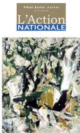
Pierre Vadeboncoeur, un homme libre