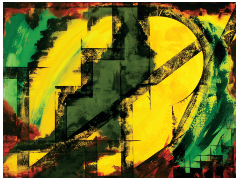
Frédéric Metthé, Beauté volée - 2010

parution novembre 2012 L'Action nationale Éditeur