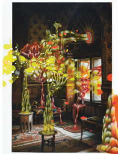
Français Reprendre l'initiative