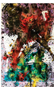
Brexit et Catalogne Les voies inconnues