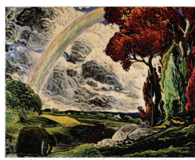
Saisir la crise