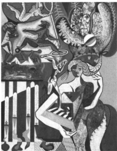
Alfred Pellán, Météore sept.

gieuses expositions. La peinture parisienne le soutenait et il n'en était pas indigne. C'est pourquoi l'histoire peut retenir son nom, toutes proportions gardées, un peu comme elle retient celui de Chirico avant que celui-ci ne soit allé se perdre aussi.