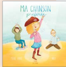
MA CHANSON PRÉFÉRÉE Pierre Labrie et Mika Espoir en canne 32 p. | 13,95$

C'est un roman lent, où la mer est omniprésente, fluctuante, à l'image de Capucine, rythmé par une plume poétique, imagée. Si Les marées nous mène loin de nos rivages, il s'avère un superbe voyage intérieur, une réflexion sur la filiation, sur l'héritage de la famille. Une histoire riche, inusitée, à lire assurément.