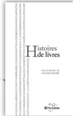
HISTOIRES DE LIVRES Collectif