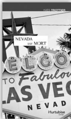
NEVADA EST MORT Yves Trottier