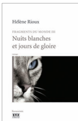
Nuits blanches et jours de gloire Hélène Rioux