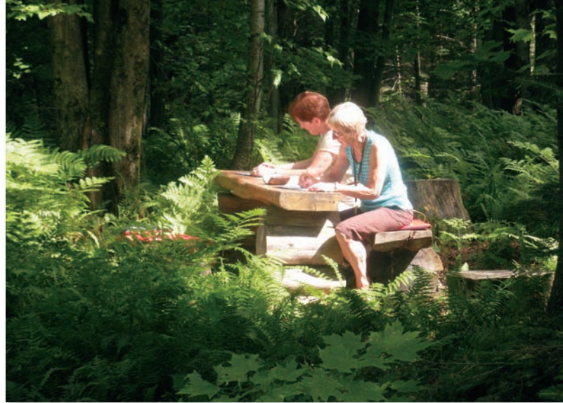
ÉCRIRE DANS LE SILENCE DE LA NATURE