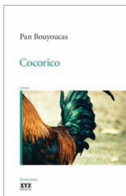
Cocorico Pan Bouyoucas