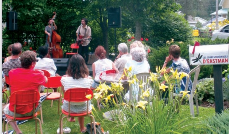
LA MUSIQUE, PARFOIS, POUR REMPLACER LES MOTS