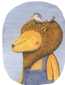
Ensemble, nous n'aurons pas froid cet hiver.