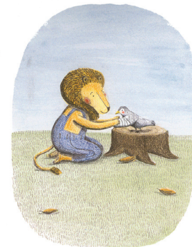
Avec un bandage, ça ira mieux.

et c'est la chouette ainsi libérée qui peut proclamer «À moi le poisson frais!»