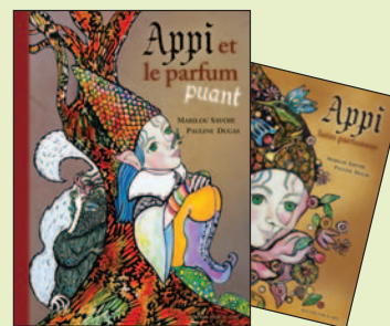
APPI ET LE PARFUM PUANT & APPI LUTIN PARFUMEUR