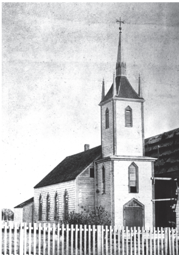
Première église anglicane St-Andrews, 1826-1894.