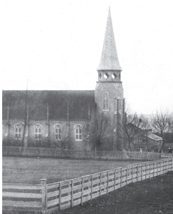
Deuxième église anglicane St-Andrews en 1901.

Un grand nombre de doctrines chrétiennes se pratiquent à New Carlisle, en particulier celles qui découlent du protestantisme. Par conséquent, construire des églises y a été une activité communautaire