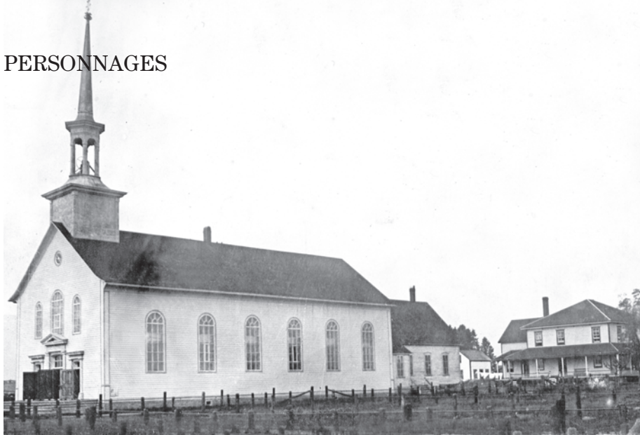
Ancienne église de Maria.

n'était à l'abri de ses remarques, de ses attaques, de ses récriminations. La Nounne en imposant sa discipline faisait peur aux plus petits. Parfois elle passait aux actes : tirer, voir tordre, une oreille lorsqu'elle pouvait accrocher un « petit effronté ». La Nounne, en poursuivant les jeunes qu'elle ne rattrapait jamais, stimulait leurs espiègleries parfois bien malicieuses! Pire encore, la rumeur courait, jamais avérée d'ailleurs, que la Nounne n'hésitait pas à utiliser son vieux « douze » pour chasser les garnements de ses champs. La Nounne s'attirait la colère de ses voisins en s'érigeant en responsable de la loi et de l'ordre. Chaque jour s'ajoutait une nouvelle frasque de la vieille folle, vraie ou fausse!