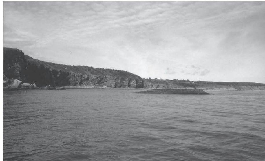
Rocher de la pointe de la baleine (Saint-Georges-de-Malbaie), 1982.

Enfin, la raison de la présence du canon anglais provenant du site DdDb3, présentement en montre au Musée de la Gaspésie, est explicable car l'emploi de canons de prises anglaises est courant à bord de corsaires français et le diamètre des boulets de facture française retrouvés sur le site est compatible avec ces canons que Lépine a identifiés comme étant de facture anglaise. Le passé « corsaire » du Jean Joseph explique bien des choses.