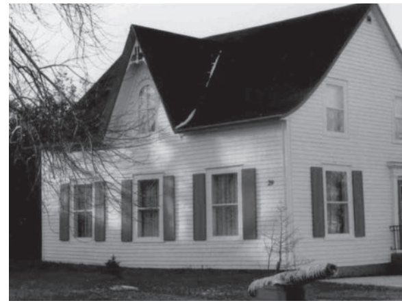
L'un des canons s'est retrouvé sur la propriété d'Yvon Fortin à Gaspé.