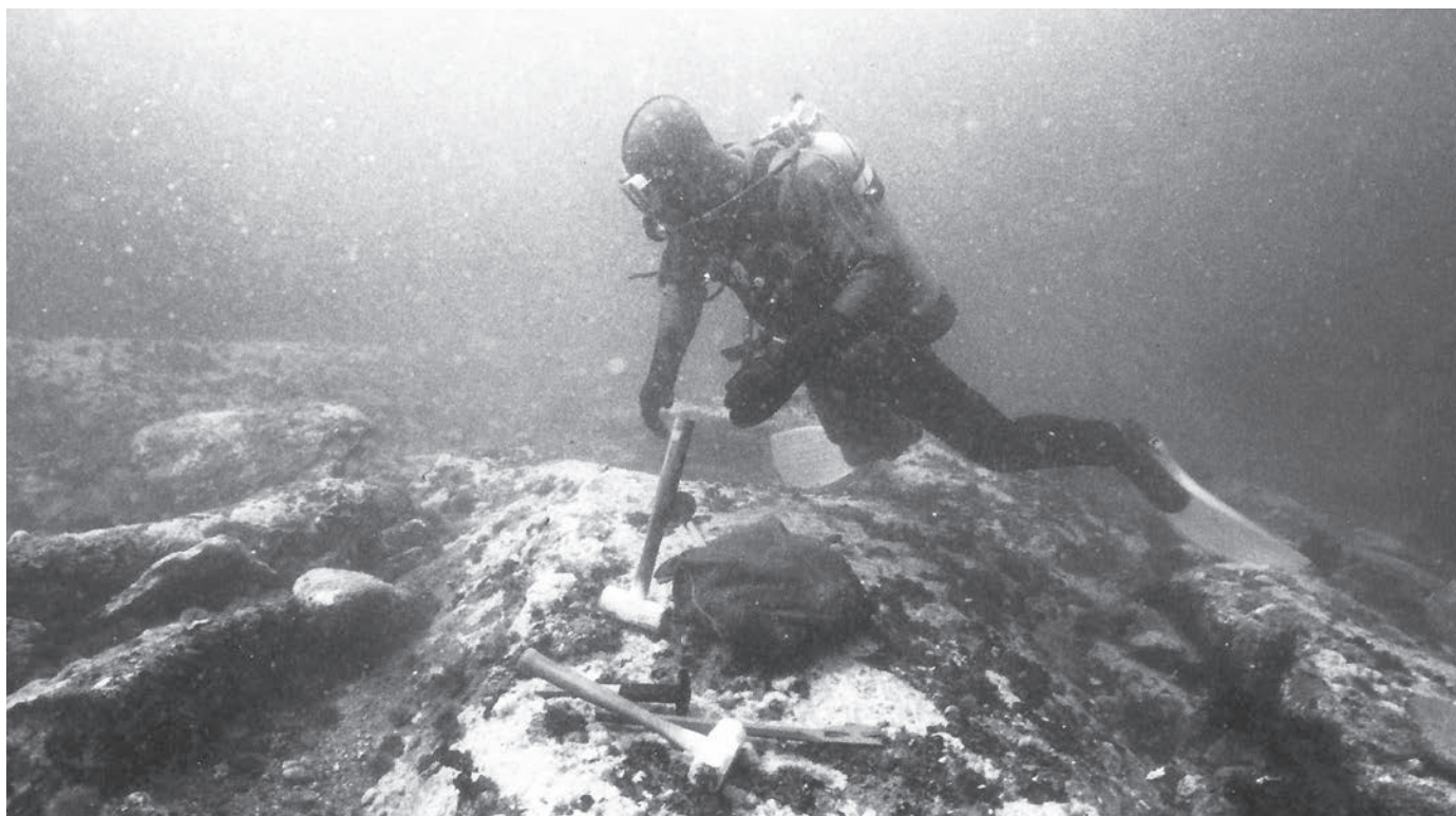
Plongeur sur le site du Jean Joseph .