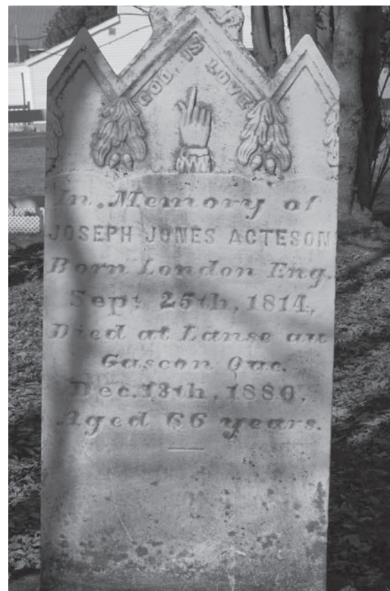
Pierre tombale de Joseph Jones Acteson. Photo : Paul Lemieux, 2015.

Durant les jours suivants, au gré des marées, la mer a rejeté sur la grève quantité de produits, caisses de liqueurs, meubles, habits, denrées de toutes sortes qui, selon le récit de J.J Acteson, ont trouvé preneurs auprès des gens de l'endroit. Quant aux 40 boîtes scellées, cinq d'entre elles ont été retrouvées et expédiées à Québec. Mais il en restait 35 dont on a complètement perdu la trace. Quant aux survivants, ils ont été secourus par les familles des pêcheurs locaux.