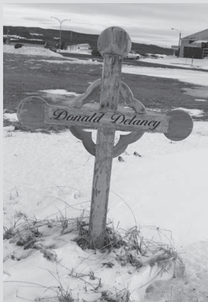
Croix à la mémoire de Donald Delaney disparu avec l' Ecstasea .