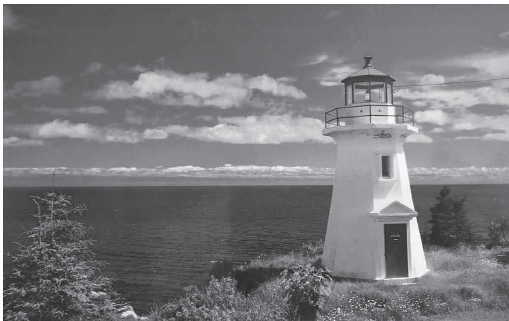
Les phares de Cap-Chat, de Cap Blanc et de Port-Daniel Ouest (celui-ci) sont sur des propriétés privées.

Les organismes intéressés à la prise en charge d'un phare avaient jusqu'au