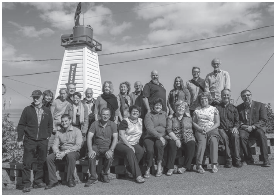
Les membres de la Corporation des gestionnaires de phares à leur assemblée générale tenue à Saint-Siméon (Charlevoix) en 2016.

29 mai 2012 pour présenter une « pétition », c'est-à-dire une lettre d'intérêt comprenant la signature de 25 noms pour signaler leur intention de conserver un phare jugé excédentaire par les autorités fédérales. Chaque entité ayant signalé sa volonté d'acquérir un phare devait par la suite s'engager à produire un plan d'affaires. Ce dernier devait