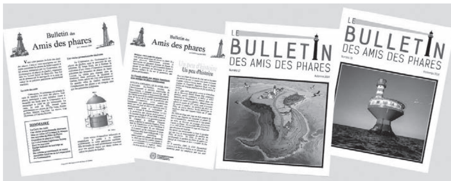
Le Bulletin des amis des phares est publié par la Corporation des gestionnaires de phares deux fois par année.

pour les aider à faire reconnaître leur phare comme patrimonial. Ces comités sont composés de passionnés, souvent bénévoles, qui tiennent leurs phares et les autres bâtiments en bon état et ouverts au public. Ils investissent leur temps et leurs ressources financières pour assurer la pérennité de ces structures maritimes abandonnées par les paliers gouvernementaux.