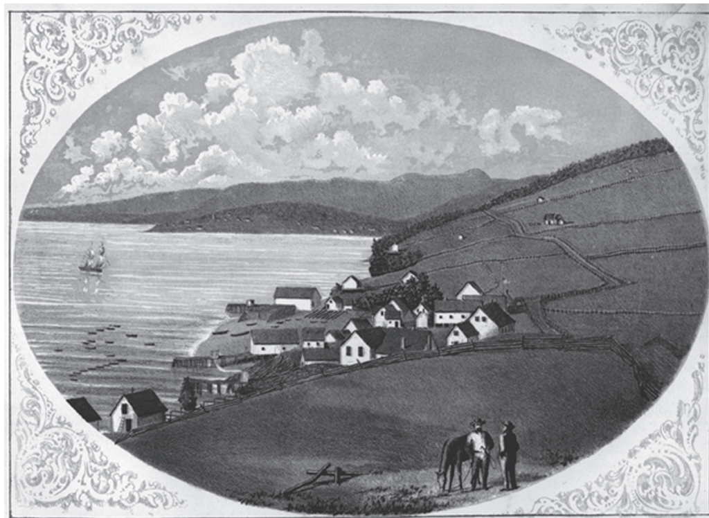
La coutume du mât de tempérance est remarquée à Grande-Grave en 1868.

En 1868, l'abbé Blais nous instruit de la coutume du mât de tempérance à Grande-Grave : « Les catholiques de la Grand'Grave [...] allèrent dans le bois couper un pin vétérans de la forêt, pour servir de mât de tempérance. Le mât surmonté d'une croix, planté en face de la chapelle située sur une colline qui domine toute la baie de Gaspé [...]. Là, à genoux au pied de la croix, tous promirent solennellement de garder partout, en public comme en particulier la sainte tempérance. [...] Par une convention faite entre le missionnaire et ses paroissiens, chaque fois que le missionnaire les visitera, le pavillon flottera au haut du mât, si la tempérance a été bien observée par tous, mais s'il y a eu quelque défection,