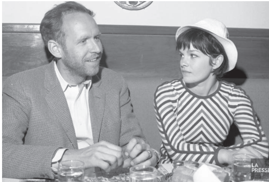
Paul Almond et Geneviève Bujold lors du tournage à Shigawake du film Isabelle en 1968.

Descendant d'un pionnier de Shigawake, Paul Almond, cinéaste et producteur, réalise plus d'une centaine de télé-dramatiques et de nombreux films à Montréal, Toronto, Londres et Los Angeles. En 1965, il fait une