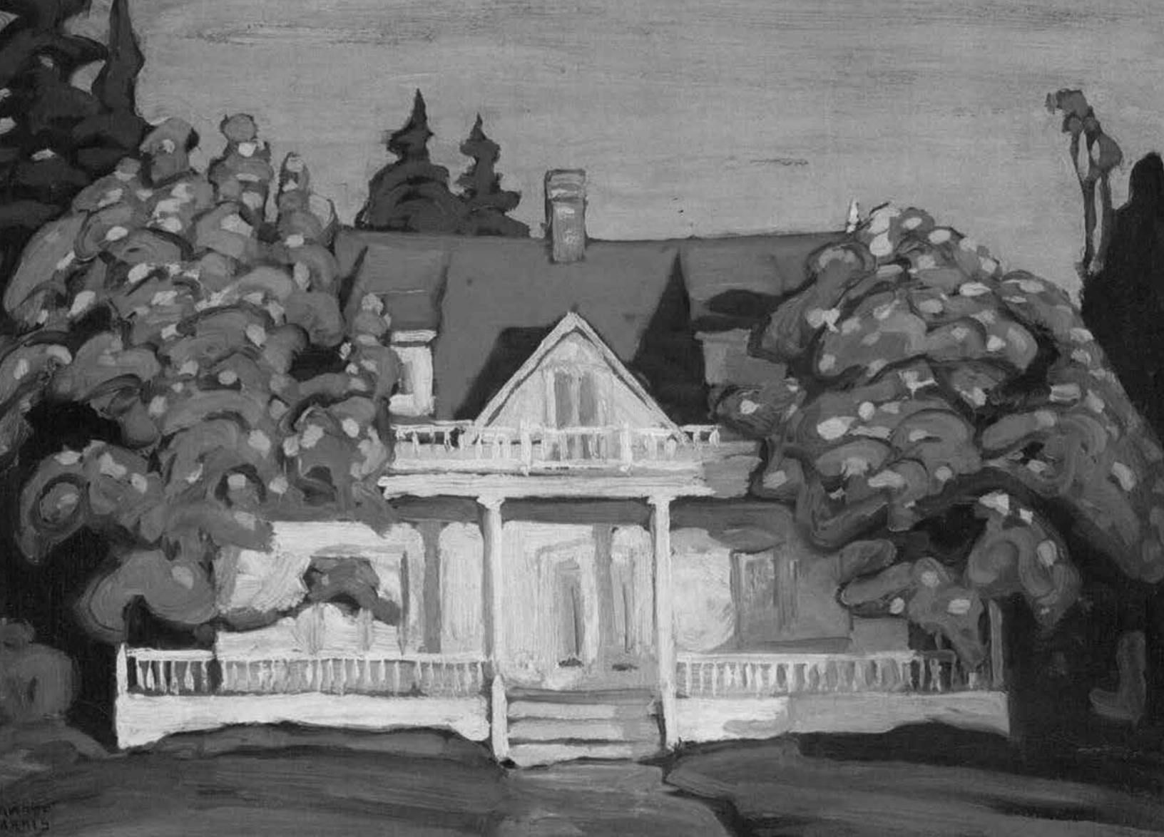
Lawren Harris, Cottage, Metis Beach, Que. , huile sur bois, vers 1916.

Photo : Heffel Gallery Ltd Collection privée