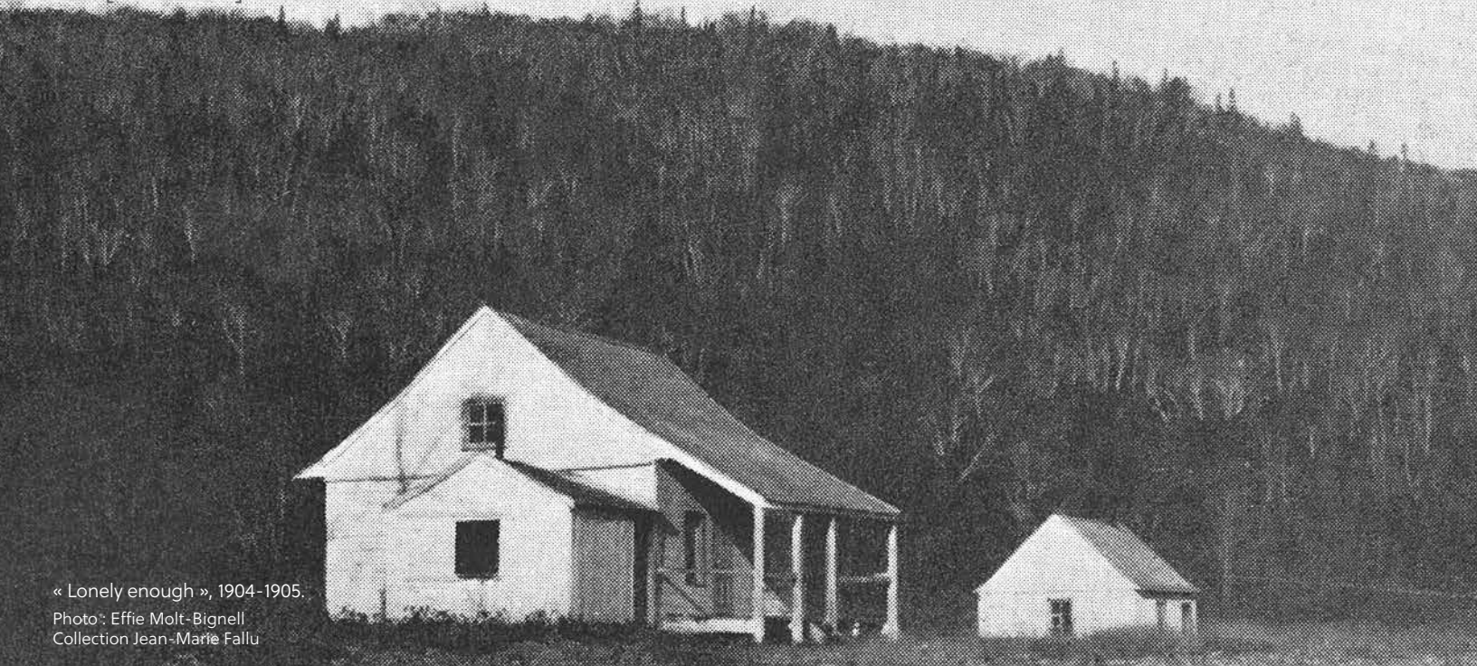
« Lonely enough », 1904-1905.